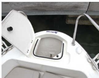
La proa con un balcón alto facilita el acceso desde el pantalán.