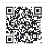
Vídeo Quicksilver Activ 455 Open (Quicksilver)

de los distintos elementos dada la limitada eslora, se agradece la protección de la bañera al quedar bastante hundida, lo que resulta más seguro con niños a bordo. La proa con un balcón semiabierto, alto, resulta muy cómodo para poder acceder por proa al barco, y presenta una tapa para el pozo de fondeo al que añadiríamos una roldana. La bañera delante reparte dos asientos, uno ocupando la banda de babor y la proa y el segundo delante de la consola. Además de contar con cofres de estiba, se pueden unir formando un solárium que ocupa toda la proa. El banco