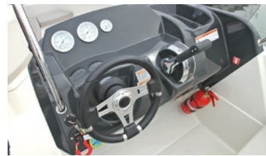
La consola de gobierno resuelve las necesidades en esta pequeña eslora: deja espacio para incorporar una pequeña pantalla.

Esta lancha polivalente mantiene una velocidad de crucero cómoda y con poco consumo en torno a los 17 nudos con un Mercury de 60 Hp.